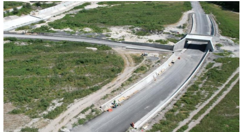
Paso deprimido vías de intercambio