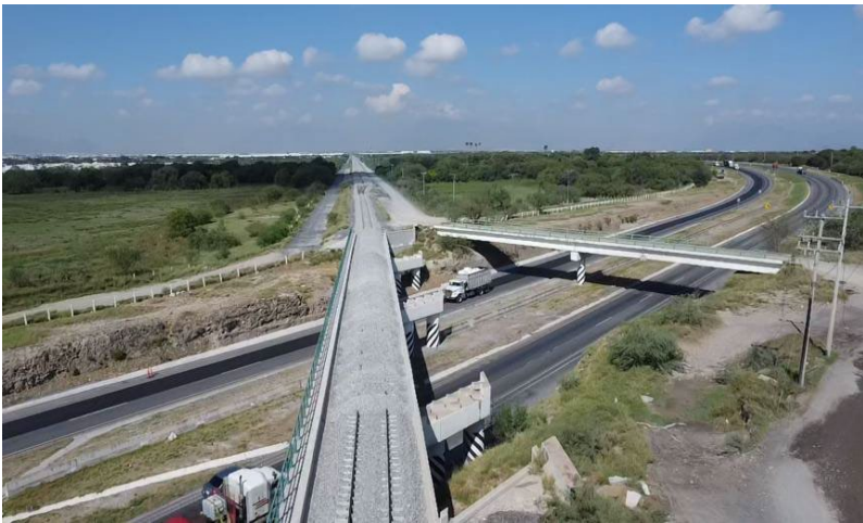
Suministro de balasto