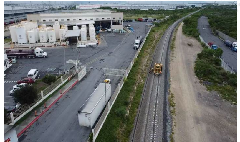
Regulado de balasto