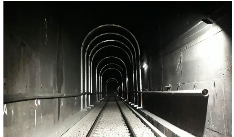
Canaletas para escurrimiento pluvial