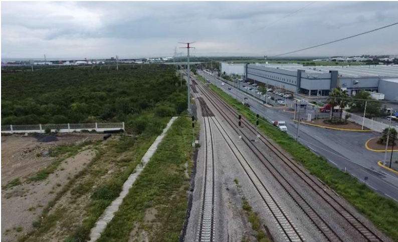
Conexión Ladero Palma