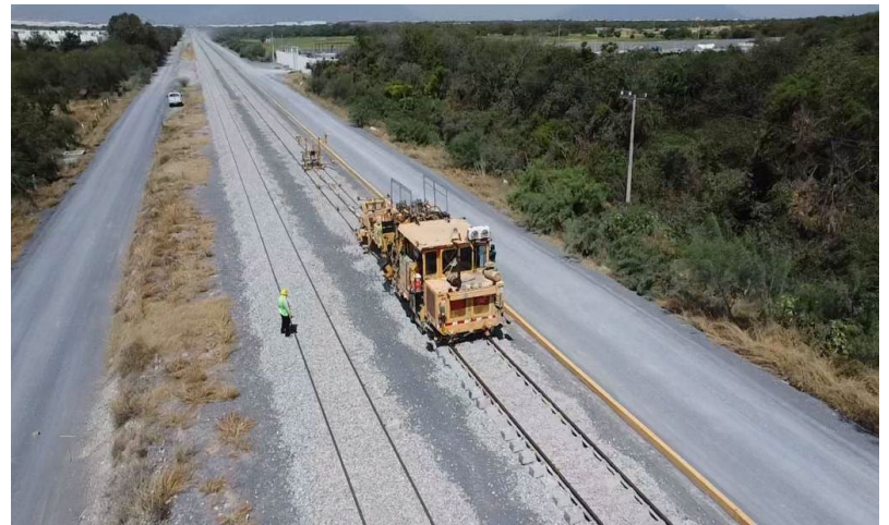
Calzado y nivelación de vía