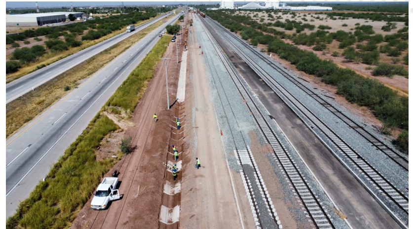
Vía3, electrificación, camino y cuneta (km T-550+100)