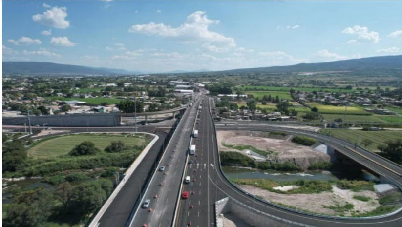
Distribuidor Vial Celanese