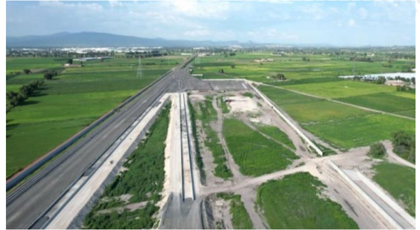
Terracerías Patio Operativo