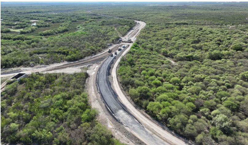
Construcción de acceso terminal pesquería