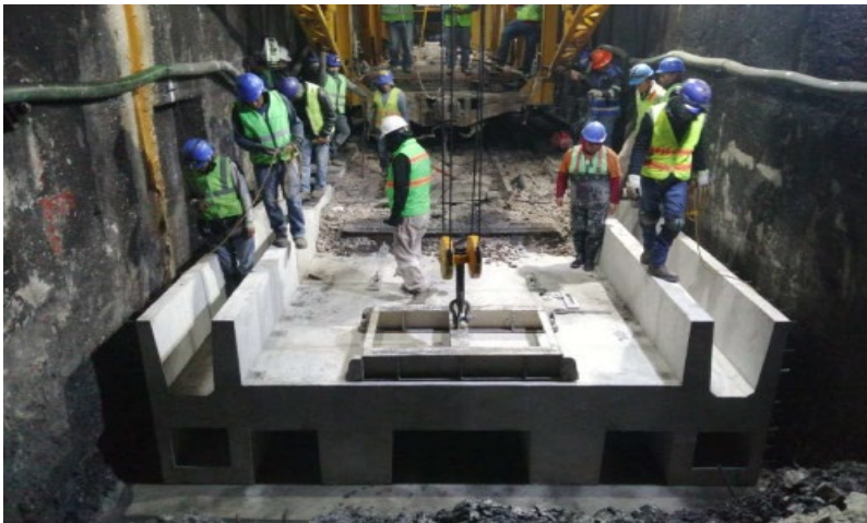
Colocación de prefabricados para el sistema de drenaje