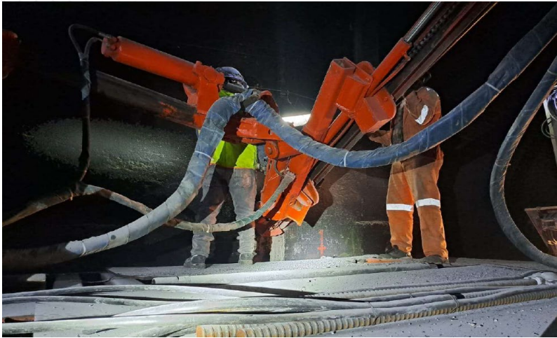
Anclaje de los muros del túnel para su reforzamiento