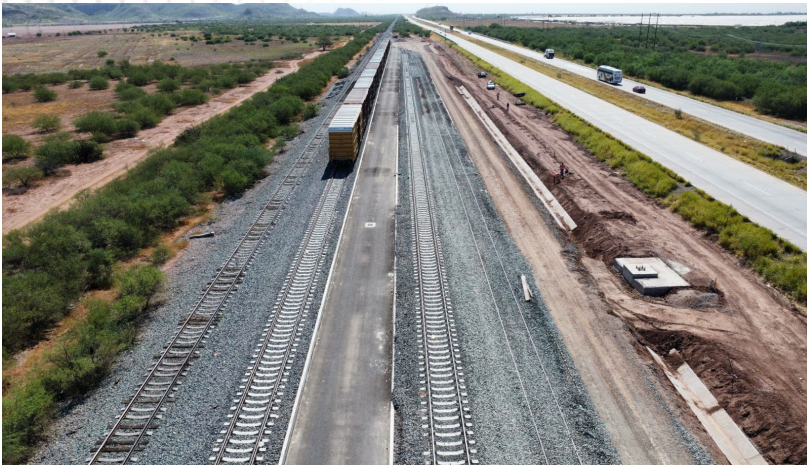
Vía3, macroposte, camino y cuneta (km T-550+200)